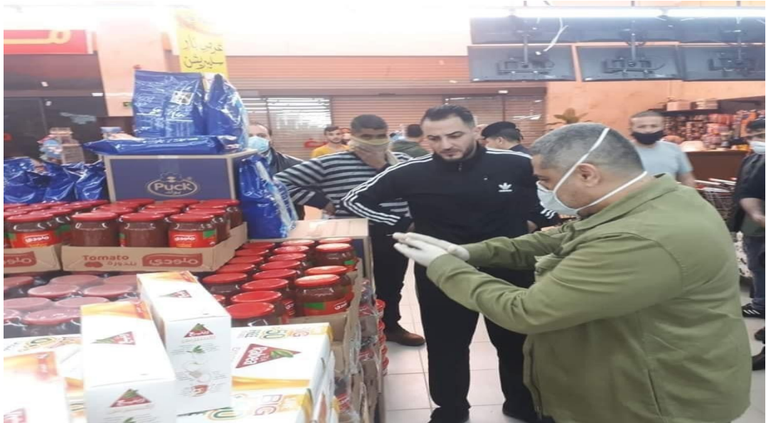
صورة لمراقب صحي يقوم بعمله في التفتيش على أحد الأسواق