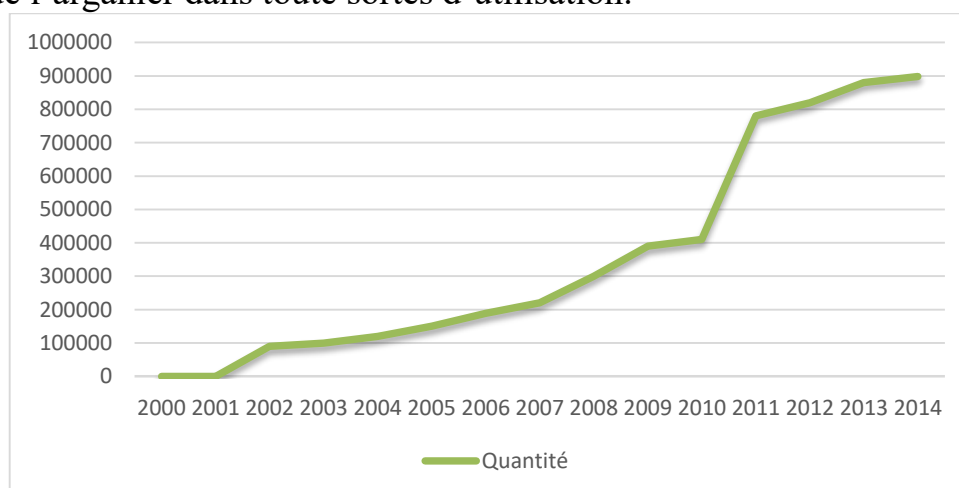
Figure 3 : Évolution de la quantité d'huile d'argan exportée entre 2000 et 2014(en tonnes)

En constate d'après le graphique ci-dessus, une demande croissante du produit de l'arganier entre l'année 2000 et 2014, cela s'explique par une meilleur qualité et efficacité de l'arganier dans toute sortes d'utilisation.